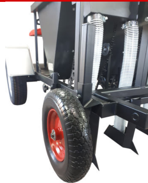
Specyfikacja techniczna sadzarka manualna